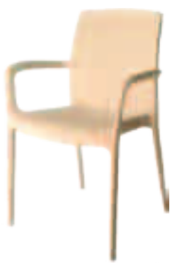
Fauteuil Betty Fr.68.-