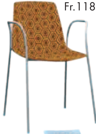
Fauteuil Alhambra Fr.118.-