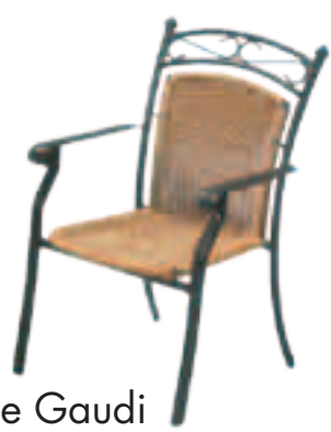
Chaise Gaudi Fr.135.-