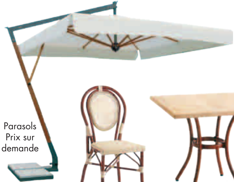
Parasols Prix sur demande