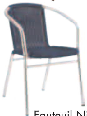
Fauteuil Nizza Fr.85.-