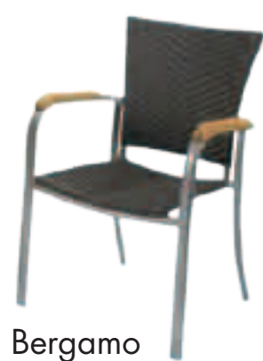
Chaise Bergamo Fr.115.-