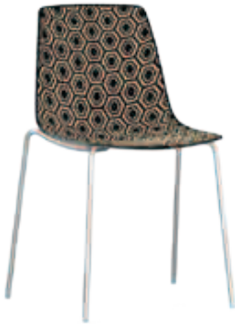
Chaise Alhambra Fr.108.-