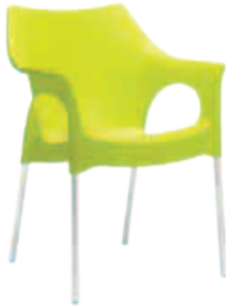
Fauteuil PA-3 Fr.108.-