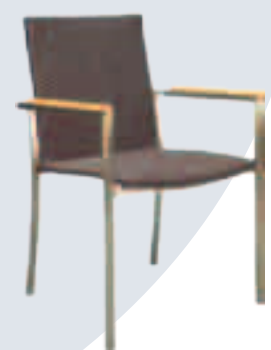
Fauteuil Mary (inox) Fr.198.-