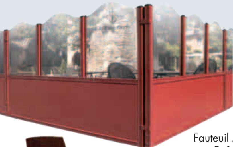
Fauteuil Michelle Fr.136.-