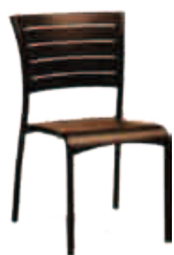
Chaise Sophie Fr.128.-