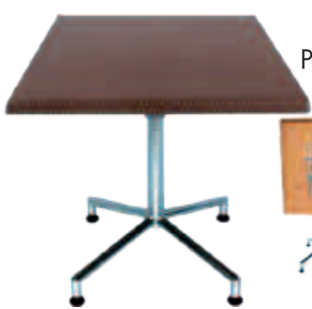
Table de 70 x 70cm Piètement zingué rabattable Plateau en Werzalit Solo Fr.268.-