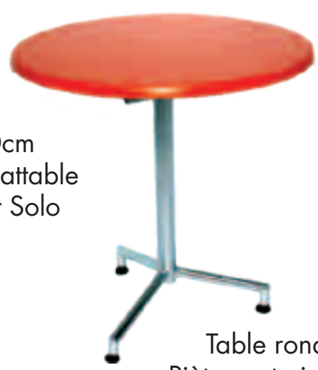
Table ronde de 70cm Piètement zingué rabattable Plateau en Werzalit Solo Fr.248.-