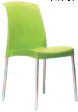
Chaise PA-3 Fr.98.-