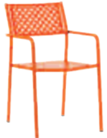
Fauteuil Lola-2 Fr.108.-