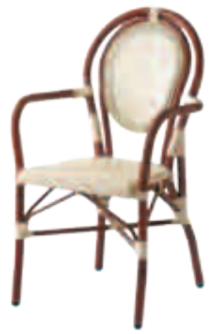
Fauteuil A-17 Fr.118.-