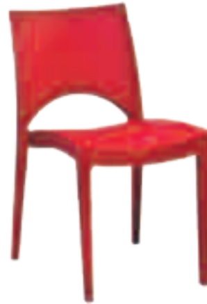
Chaise P-4 Fr.65.-