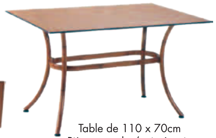
Table de 110 x 70cm Piètement alu / teinté rotin Plateau en Werzalit Solo Fr.248.-