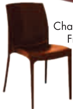
Chaise Betty Fr.58.-