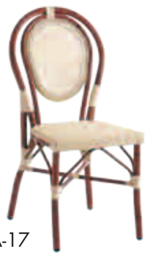
Chaise A-17 Fr.98.-