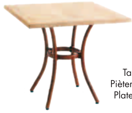
Table de 70 x 70cm Piètement alu / teinté rotin Plateau en Werzalit Solo Fr.168.-