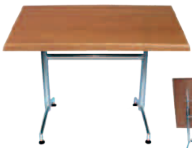
Table de 110 x 70cm Piètement zingué rabattable Plateau en Werzalit Solo Fr.348.-