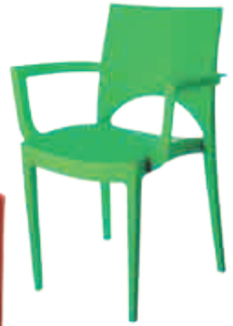
Fauteuil P-4 Fr.69.-