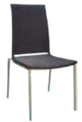
Chaise Mary (inox) Fr.142.-