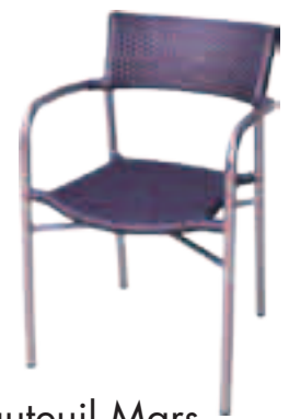
Fauteuil Mars Fr.85.-